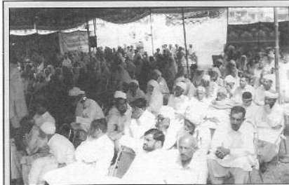
مریشاں اپنی باری کا انتظار کر رہے ہیں