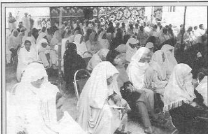
مریشاں اپنی باری کے انتظام میں بیٹھے ہیں