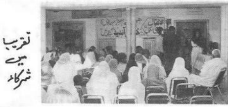
تقریب میں شرکاء

کچھ نہ جائیں پشیمیں کہ پھر سے جلا دی جائیں میری آنکھیں میرے دشمن کو لگا دی جائیں ہمارے فری آئی کیپ میں ۸۵۰ ٹولین کا سامنا کیا گیا اور ہم بڑے سائپریشن کیے گئے یہ تمام اپرٹین انجن بیہودی سر رفیقہ کے زیر اہتمام اور ڈاکٹر طارق سہیل کی زیر نگرانی ہونے جو علاقہ کے لوگوں کے لئے باہلی